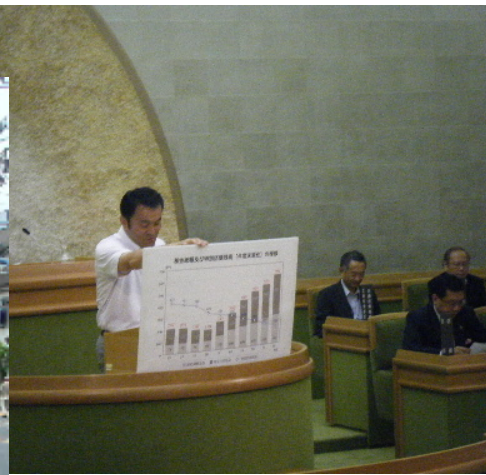
定例会にて代表質問に立つ