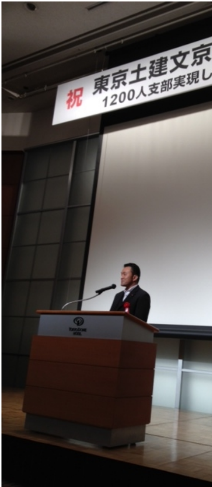
ドームホテルで祝辞