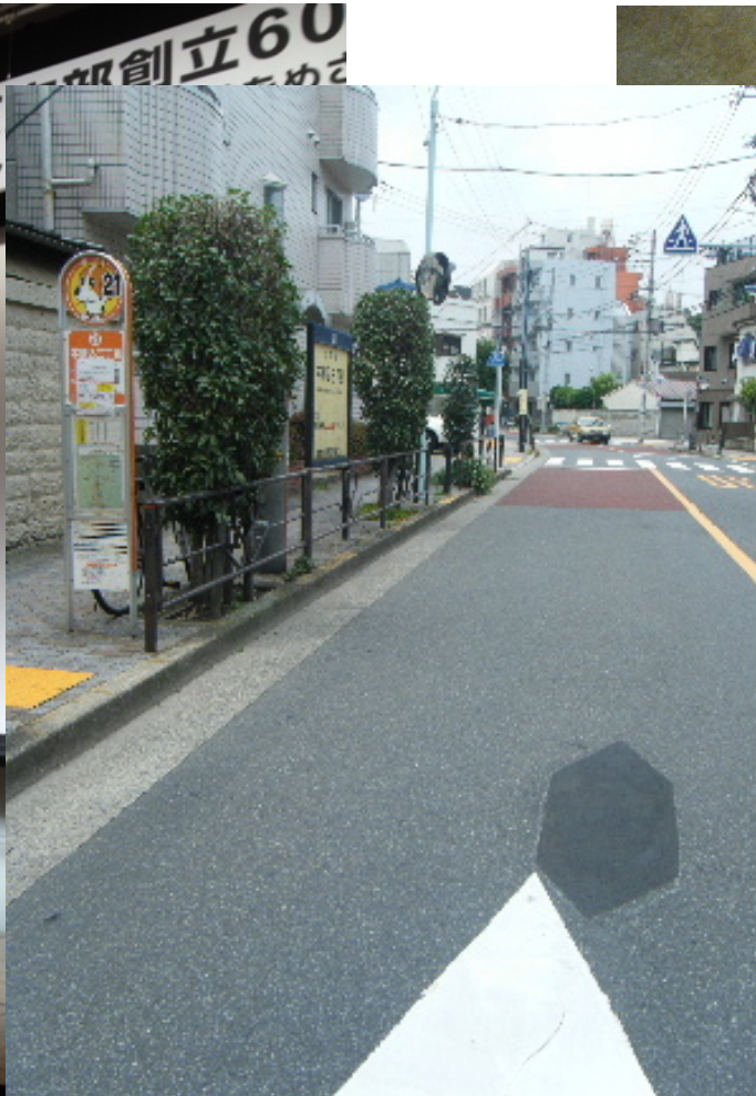
先月の駅頭で、このチラシにてFAXを頂き要望のあった、ビーグルバス停前の凹みを修復致しました。